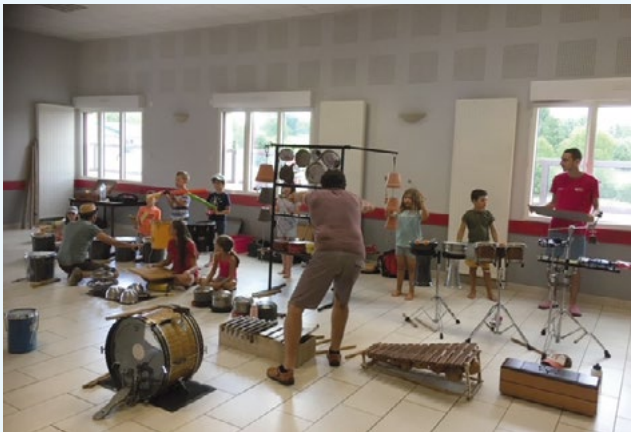
Du 18 au 22 juillet 2022, la commune a accueilli le mini camp « culture » du centre de loisirs, avec la participation du Collectif GONZO.