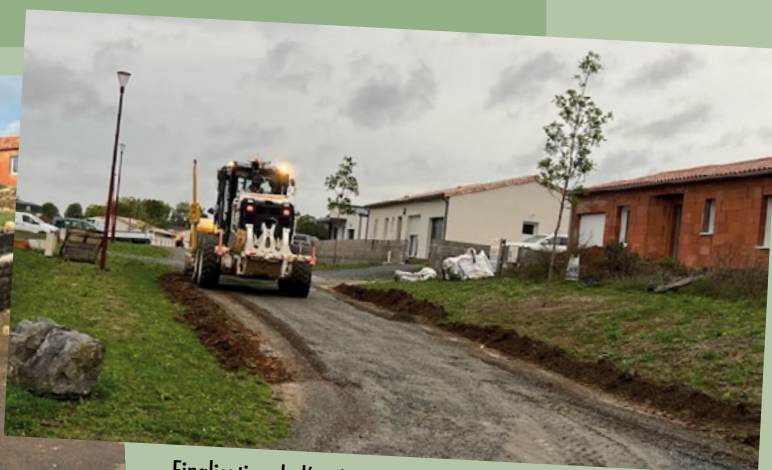
Finalisation de l'accès au hameau du Champ de la vigne 2