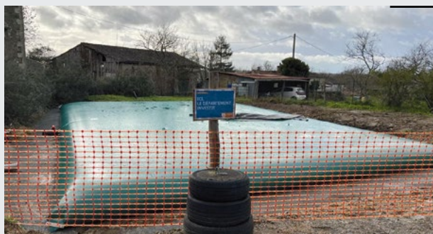
Défense incendie de Puymorillon, après travaux

À Puymorillon, mise en place d'une « citerne souple » de défense incendie en lieu et place de l'ancienne réserve ouverte.