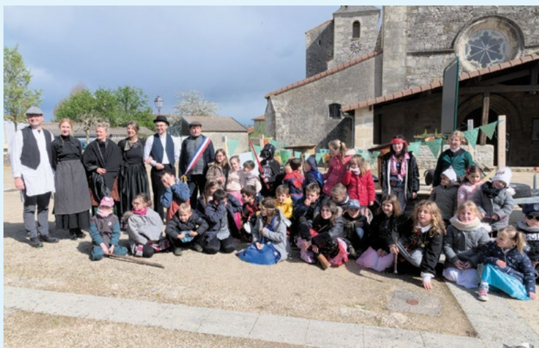
APE, carnaval 2022