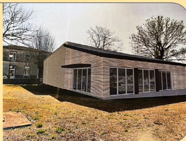
Projet annexe de la mairie