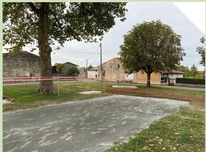
Aménagement de la place de Paunay