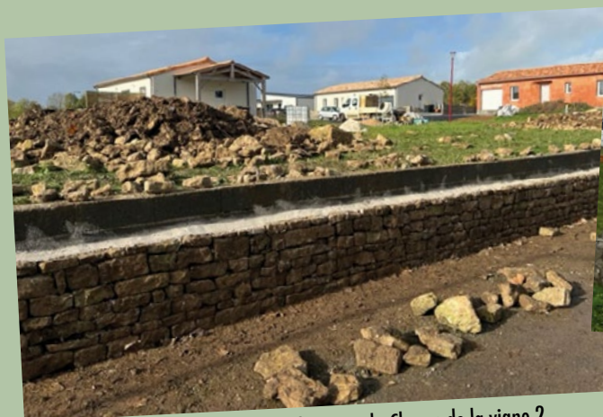
Mur en pierre, hameau du Champ de la vigne 2