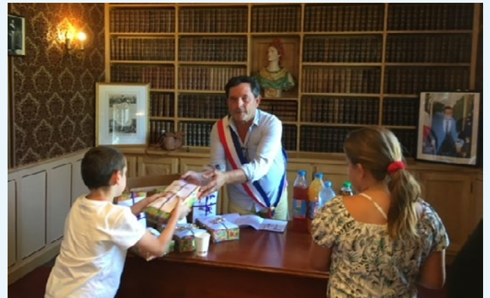
Cadeau offert aux élèves de l'école de Saivres entrant au collège

Pour la restructuration de la garderie, les plafonds ont été isolés tant au niveau acoustique que thermique.