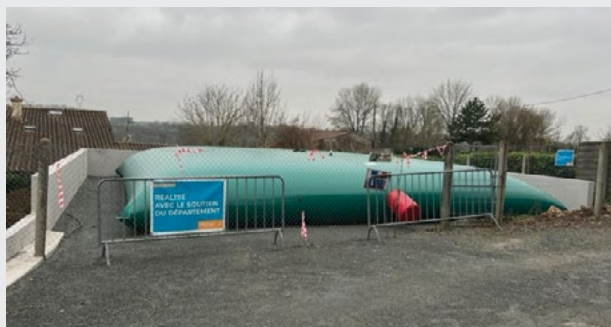
Défense incendie de Perré, après travaux

À Perré, remplacement de la « citerne souple » et création d'un mur d'enceinte.