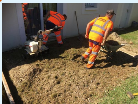
Travaux dans les logements du hameau du Grand pré